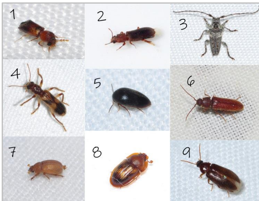
Figura 2. Especies tratadas en el presente artículo: 1. Scobicia chevrieri (Villa & Villa, 1835); 2. Trogoxylon impressum (Comolli, 1837); 3. Pogonocherus (Pogonocherus) p. perroudi Mulsant, 1839; 4. Opilo domesticus (Sturm, 1837); 5. Nycteus meridionalis Laporte de Castelnau, 1838; 6. Anelastidius feisthameli (Graëlls, 1847); 7. Glaresis hispana (Báguena Corella, 1959); 8. Amphotis martini Brisout de Barneville, 1878; 9. Hymenorus andalusiacus Cobos, 1954.